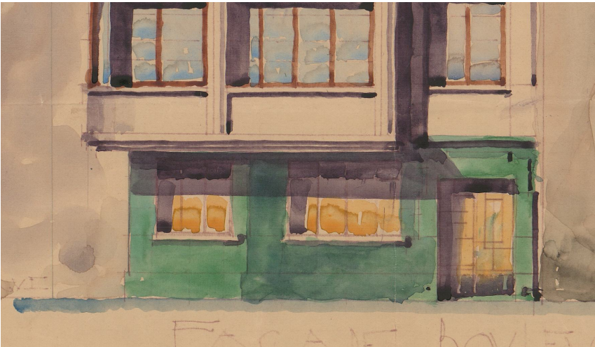
FACADE (Blvd de Waterloo)