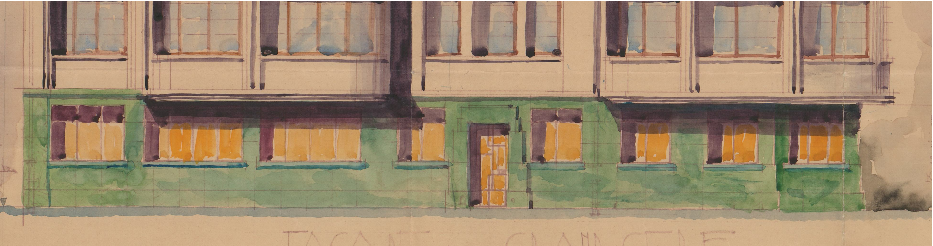
FACADE (Rue du Grand Cerf)